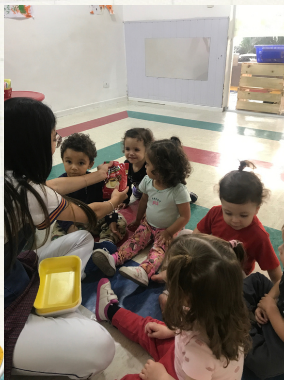
G.M e L.M gostaram de sentir o cheiro do café