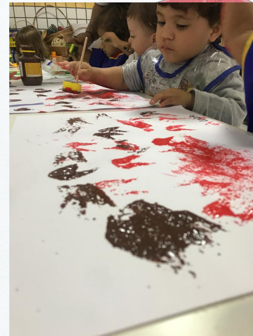
A.C observava atentamente todos os carimbos que fazia.