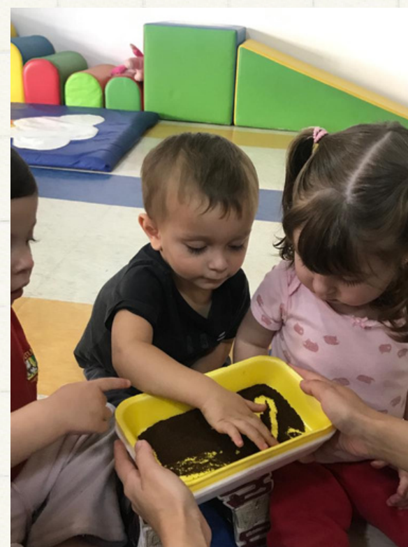
A berçarista pediu para o R.G e L.P fazerem um coração e eles tentaram.