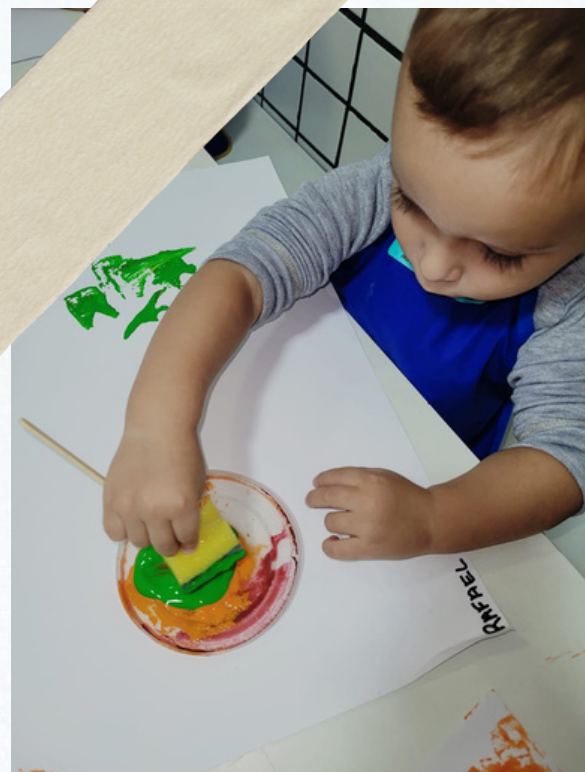
R.G usou suas habilidades motoras para levar seu carimbo na tinta depois carimbar na folha